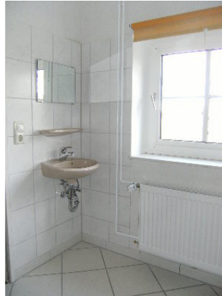
Das Schlafzimmer 3

Das Badezimmer 2 ist über das Schlafzimmer 2 erreichbar, siehe Grundriss.