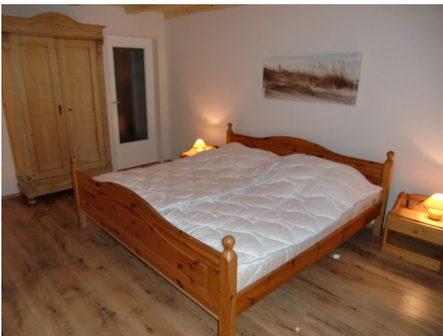
Das Schlafzimmer 1 mit Doppelbett