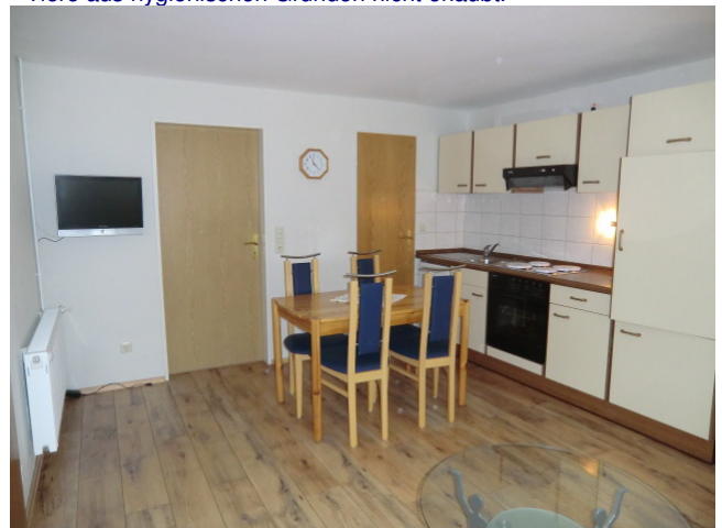
Das Wohnzimmer mit Essecke: (Ansicht Rechts)