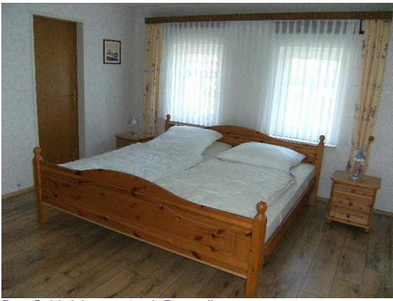
Das Schlafzimmer 2 mit Doppelbett