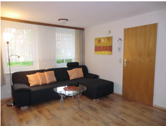
Das Wohnzimmer mit Essecke: (Ansicht Links)