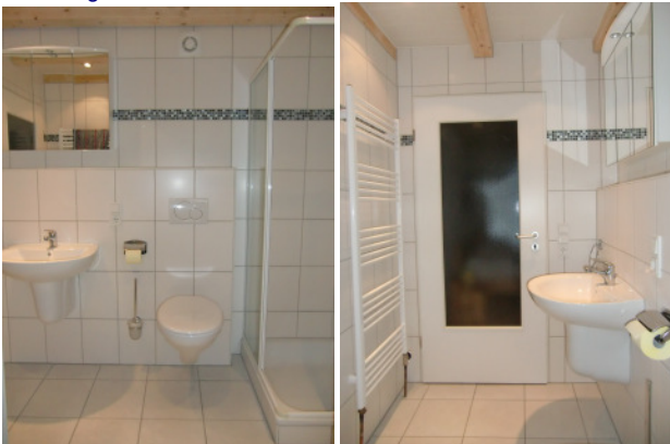
Das Badezimmer 1