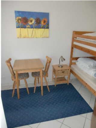
Das Schlafzimmer 3 mit Etagenbett