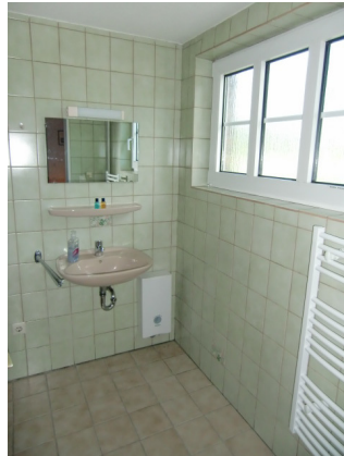
Das Badezimmer 2