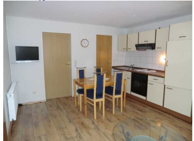
Das Wohnzimmer mit Essecke: (Ansicht Rechts)